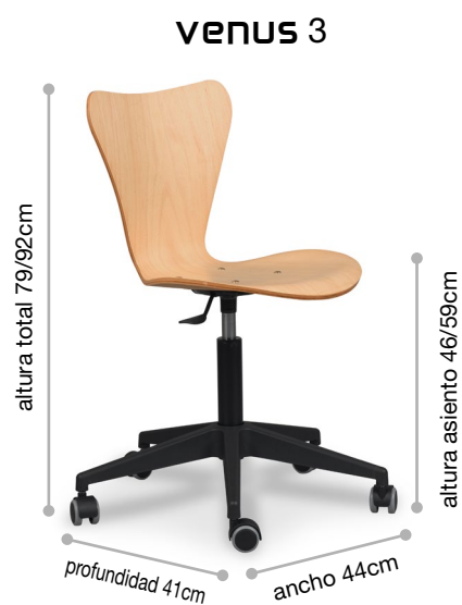
Tabla de precios