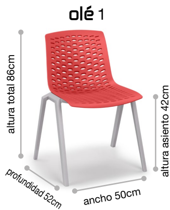
Tabla de precios