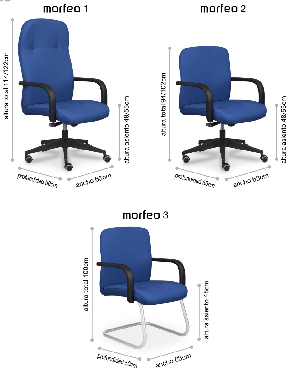
Tabla de precios